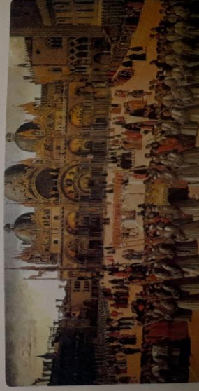
6) es didad

[El comercio con Oriente y a través de África se limitaba a bienes muy caros, que poca gente podía comprar, como las llamadas especias, que eran sustancias para cocinar y conservar alimentos, medicinas y perfumes. En cambio, en algunas regiones europeas –como aquellas localizadas a orillas del mar Báltico y del mar del Norte–, se negociaban productos más baratos, como los cereales y los textiles, que consumían muchas personas.]